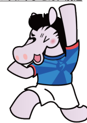
合格応援サポーター シマウマ しまお